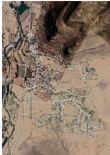
CRUCIOS DE LOCALIZACION